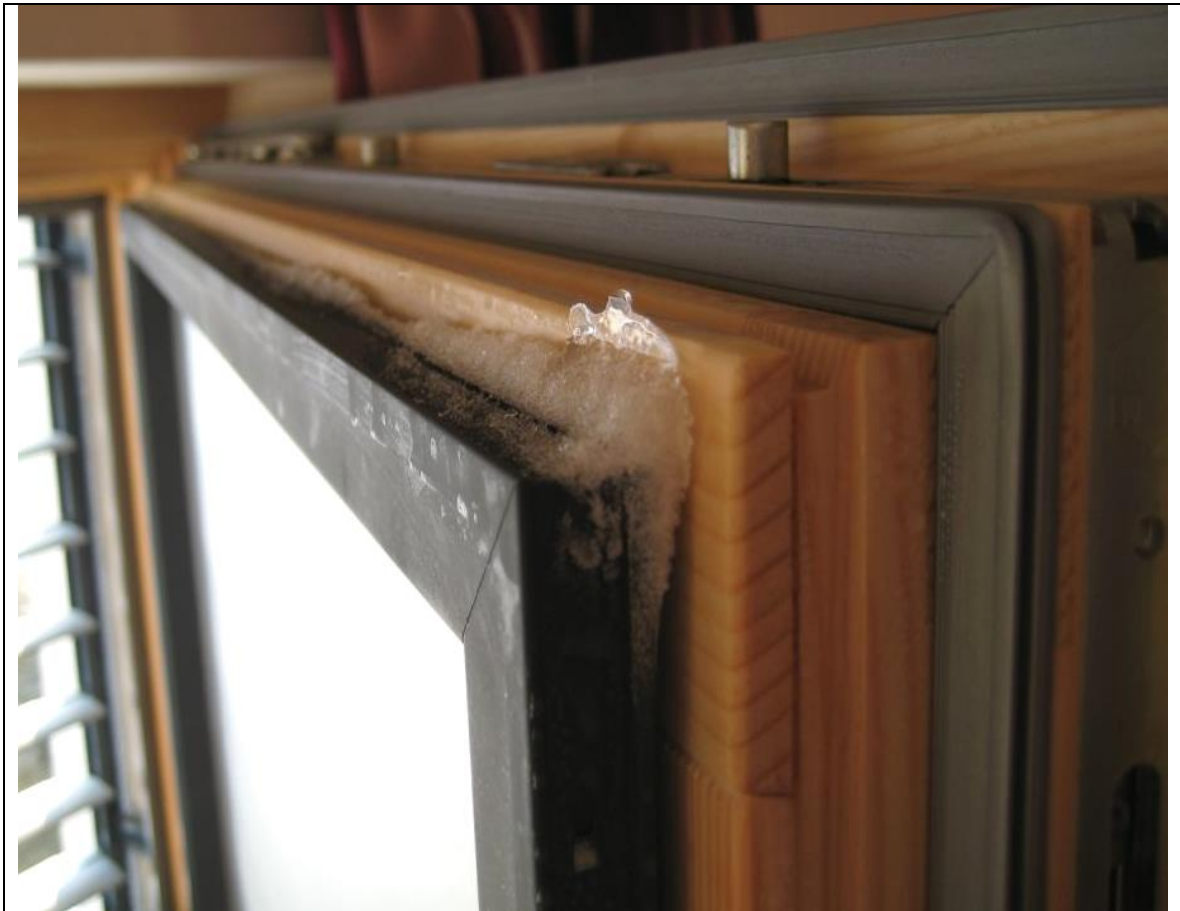
Eisbildung bei Holz-Aluminium-Fenstern ist keine Seltenheit

Damit dieses Problem entsteht, sind keine erhöhten Luftfeuchtigkeitswerte nötig. Eine Raumluft von unter 40% bei +21°C Zimmertemperatur reichen dafür völlig aus.